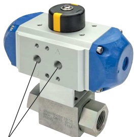
für Namuranschluss und IG

TIPP Anschlussbild nach NAMUR, mit Innengewinde!